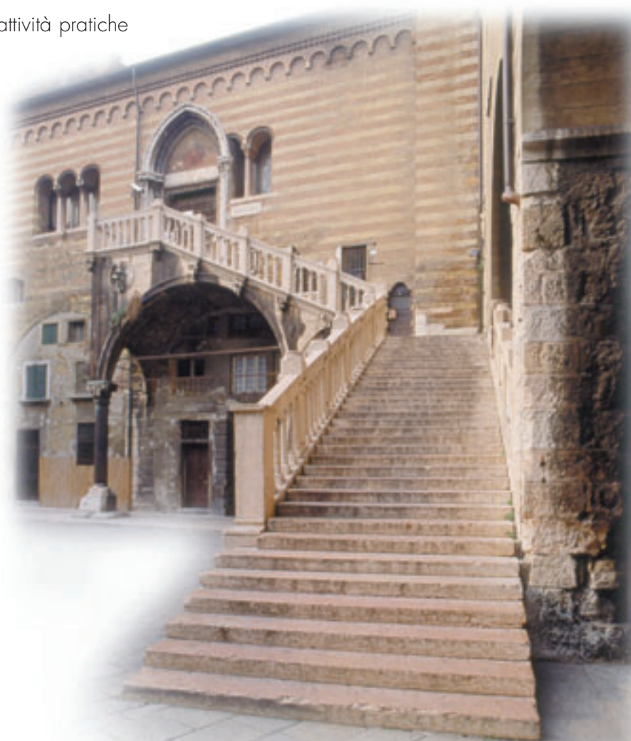
Verona - Scala della Ragione

Il materiale verrà esaminato da un comitato speciale.