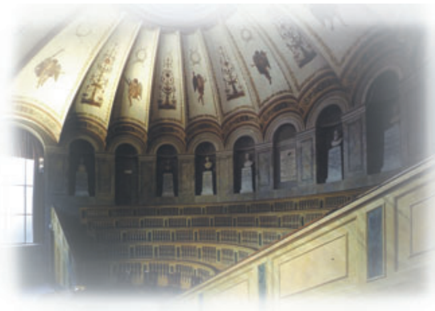
Università di Pavia - Aula Scarpa

Per l'elenco completo delle attrazioni culturali e turistiche, le date e i prezzi, visitate il sito Web all'indirizzo: www.isapa2005.net .