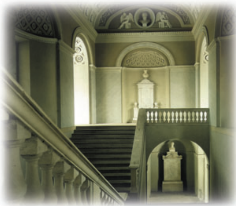
University of Pavia - The grand Staircase of Honor

Venice km. 114 Milan km. 161 Bologna km. 142 Florence km. 23