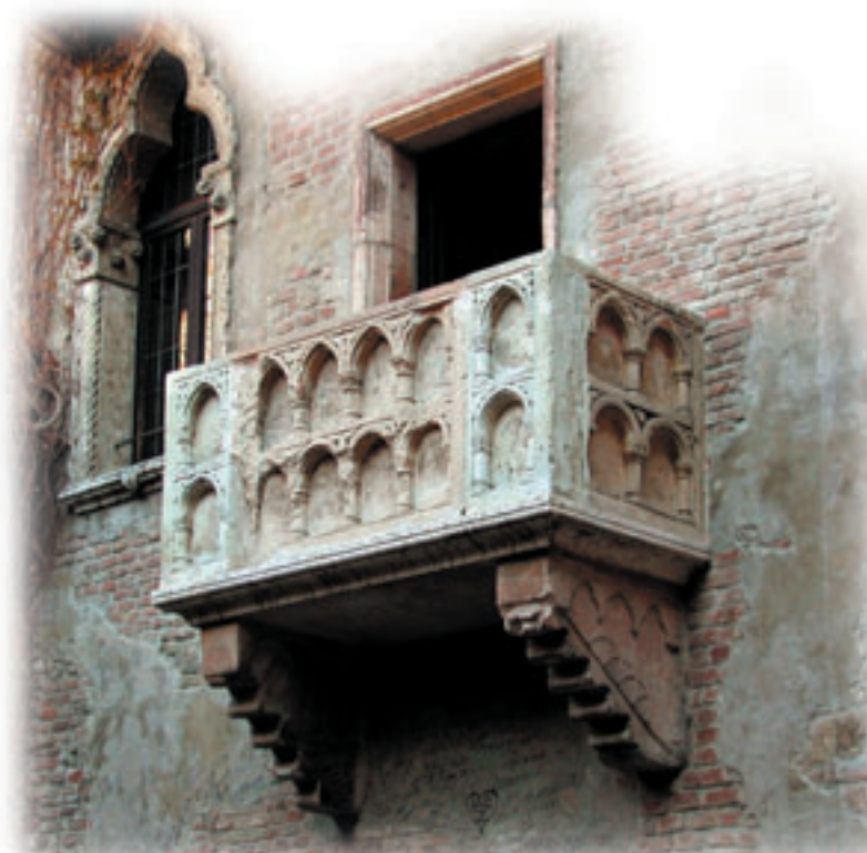
House of Julietta Capuleti